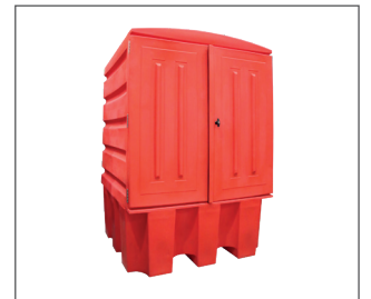
Option couleur rouge Réf. CGM1/100014F