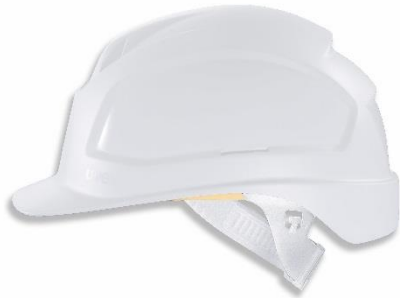
Casque uvex pheos E