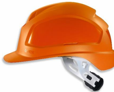
Casque uvex pheos E-WR