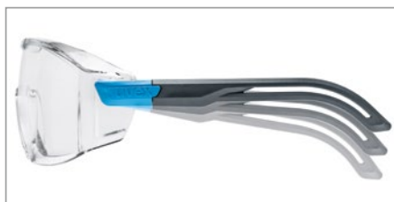
3 niveaux d'inclinaison des branches pour un ajustement personnalisé