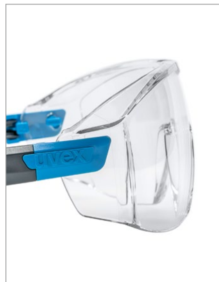
x-tended sideshield pour une protection de la région oculaire latérale