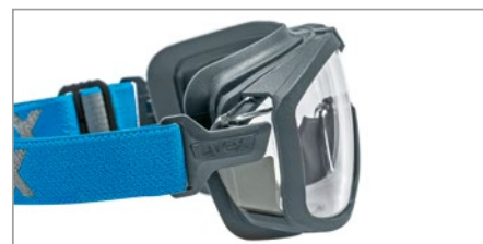
x-tended sideshield pour une protection de la région oculaire latérale