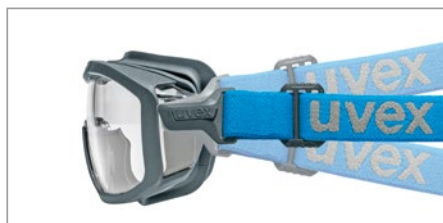
Bandeau réglable individuellement pour un ajustement parfait et un maintien sûr