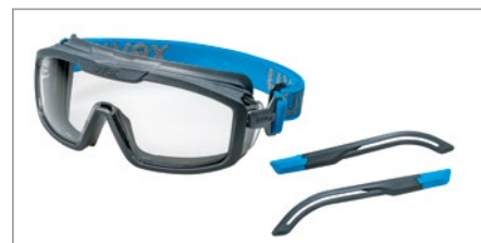
Kit uvex i-guard+ ajustable individuellement pour toutes les utilisations grâce au remplacement facile des branches et du bandeau