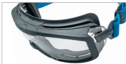
Pont de nez souple et flexible en matériaux durables pour un ajustement universel