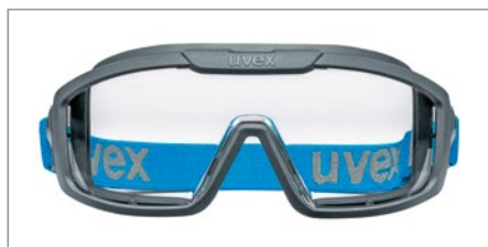
Oculaire au design plat pour un champ de vision dégagé

La ventilation indirecte assure une ventilation optimale à l'intérieur : grâce à la technologie de traitement uvex supravision éprouvée, l'oculaire reste exempt de buée même en cas d'effort plus important et garantit une visibilité optimale à tout moment.