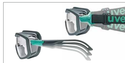
3 niveaux d'inclinaison des branches et du bandeau pour un ajustement individuel