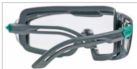
Branches ergonomiques pour un ajustement parfait et un maintien stable sans points de pression