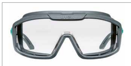
Oculaire au design plat pour un champ de vision dégagé

La gamme uvex i-range planet est flexible et contribue efficacement à la protection de l'environnement, conformément à notre devise protecting planet .