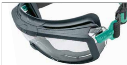
Pont de nez souple et flexible en matériaux durables pour un ajustement universel