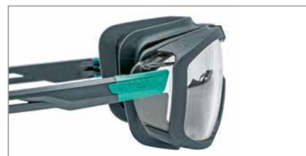
x-tended sideshield pour une protection de la région oculaire latérale